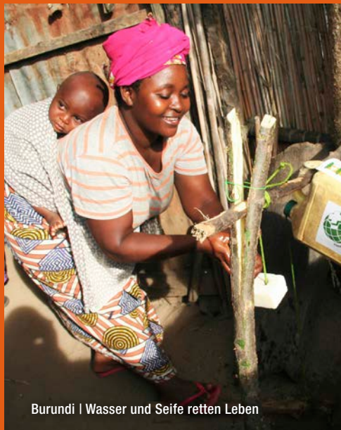
Burundi | Wasser und Seife retten Leben