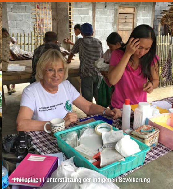
Philippinen | Unterstützung der indigenen Bevölkerung