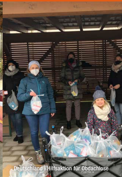
Deutschland | Hilfsaktion für Obdachlose